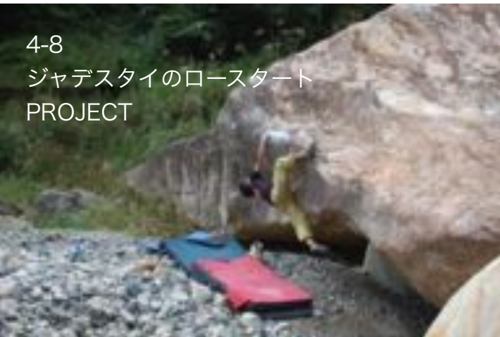
4-8 ジャDESTAIのロースタート PROJECT