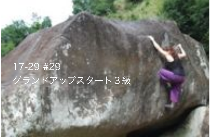
17-29 #29 グランドアップスタート 3級