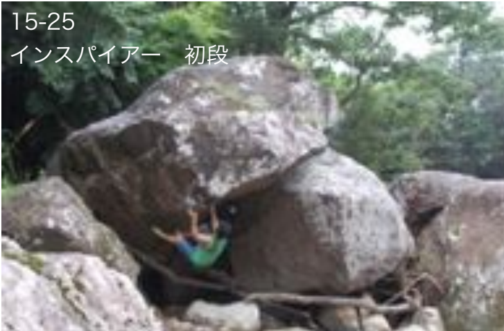
15-25 インスパイアー 初段