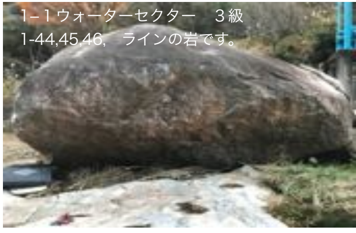
1-1 ウォーターセクター 3級 1-44,45,46, ラインの岩です。