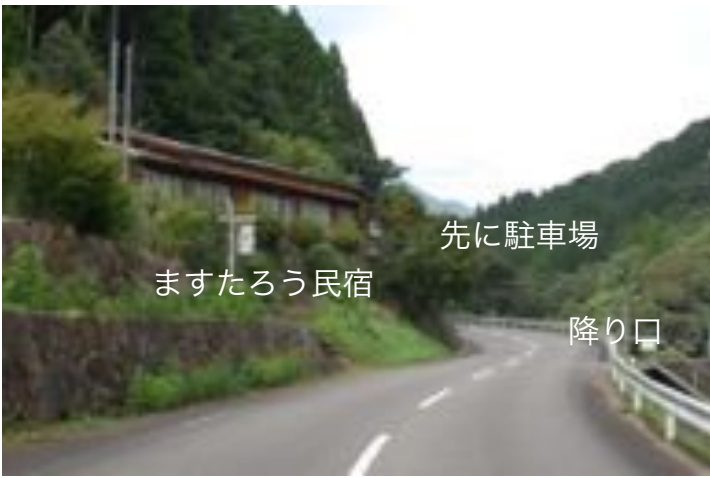
先に駐車場 ますたろう民宿

民宿 ますたろうさんを過ぎて標識下右手に大きな駐車場があります。駐車して徒歩でアプローチして下さい。水門降り口の鉄階段を利用させていただきます。