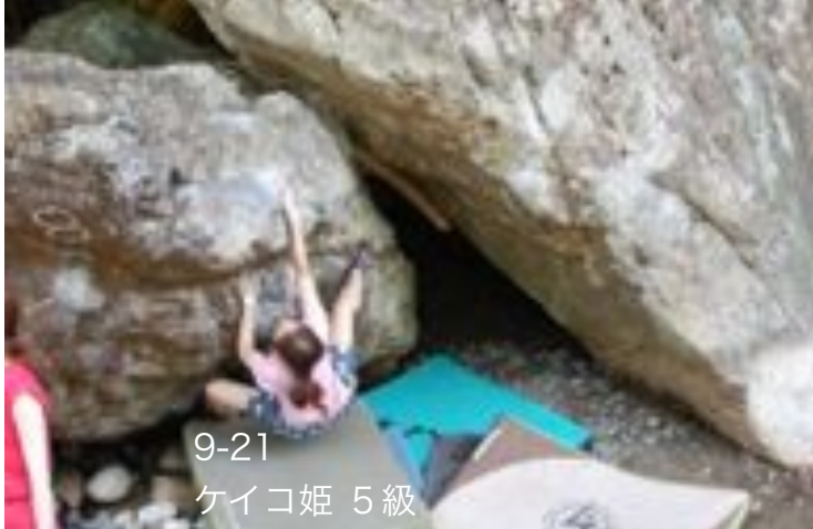
9-21 ケイコ姫 5級