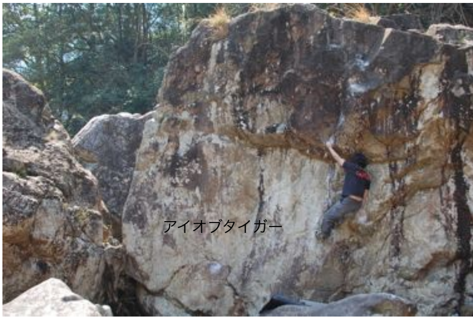
アイオブタイガー