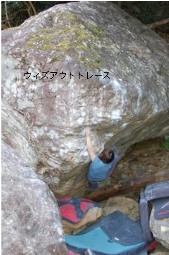
ウィズアウトトレース