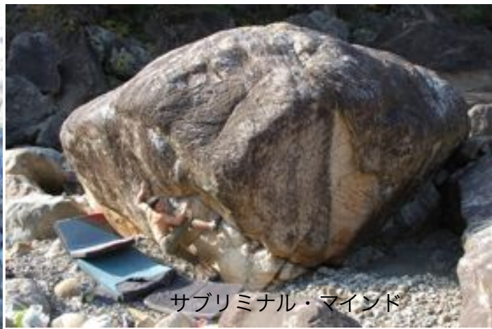
サブリミナル・マインド