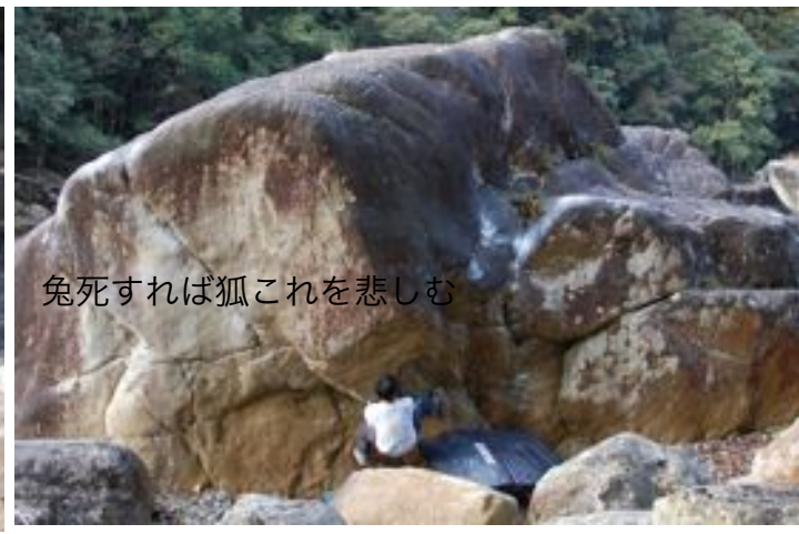
兔死すれば狐これを悲しむ