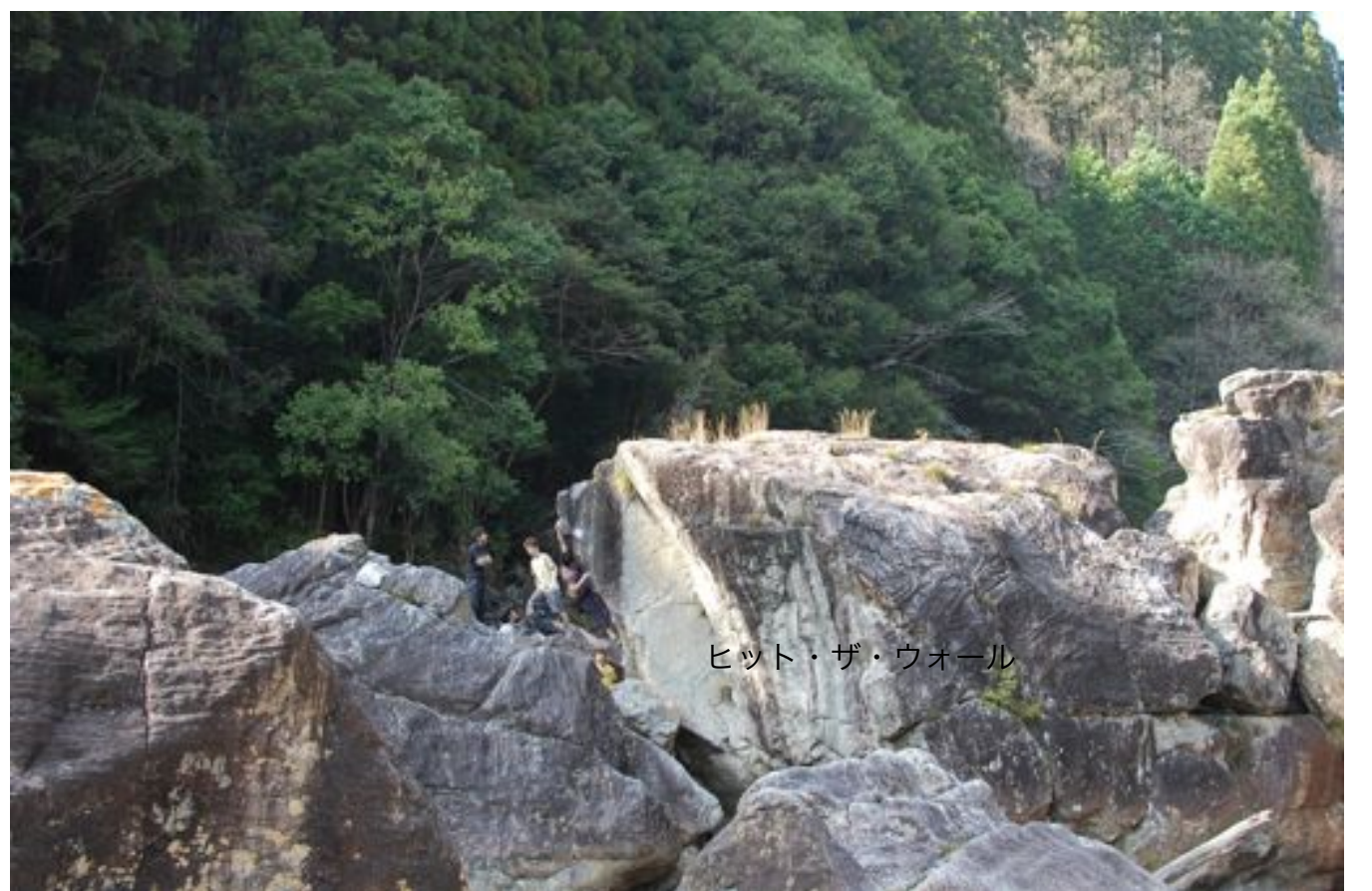
ヒット・ザ・ウォール